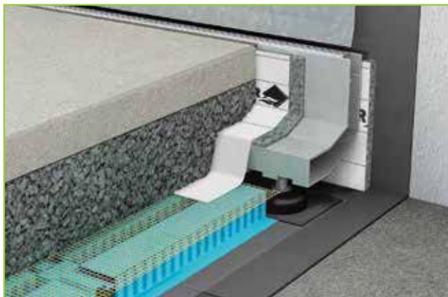
AquaDrain® SR-W für den Wandeinbau oder vor Brüstungen

AquaDrain® SR sind Schlitzrinnen, die sich unauffällig in die Belagsfläche einfügen. Der im Gegensatz zu herkömmlichen Schlitzrinnen nach unten offene Rinnenkörper sorgt für die sichere und schnelle Abführung von Oberflächenwasser direkt in die Drainschicht.